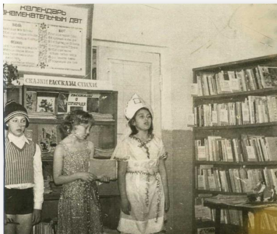
Фрагмент праздника посвящения в читатели, 1984г.

изучению творчества художников – это и Васнецова, и Рериха, и Сурикова, и Шишкина. Ребята часто иллюстрировали сказки, мастерили поделки, принимали участие в викторинах. Раз в месяц в библиотеке устраивались громкие чтения для учащихся младших классов. По дневникам можно отметить, что любимым писателем работников библиотеки был Аркадий Петрович Гайдар. Ежегодно по его произведениям проводились беседы и викторины, оформлялись книжные выставки.